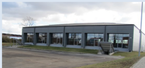
Angegliederte Dreifachturnhalle als Ausstellungsraum