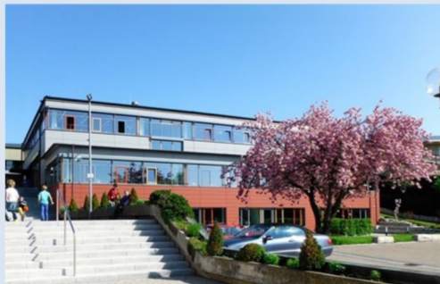
Grundschule Tapfheim Schulstraße 8 86660 Tapfheim